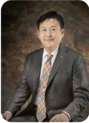
대표이사 / 외식경영컨설턴트