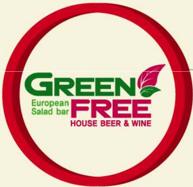
▲ 그린프리 브랜드 네이밍, BI, 디자인패키지

저희 (주)빔코리아는 가성 디자인과는 달리 매장의 특성을 고려한 맞춤형 디자인으로 매장의 매출 증진에 기여하고 있습니다. 한국 외식 문화를 앞서가는 고객님께 한국 외식 사업의 발전을 위해 노력하는 든든한 동반자가 되겠습니다.