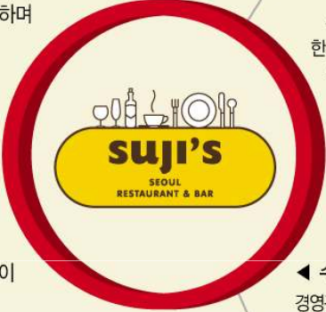
◀ 수지스 경영관리 및 운영매뉴얼 컨설팅