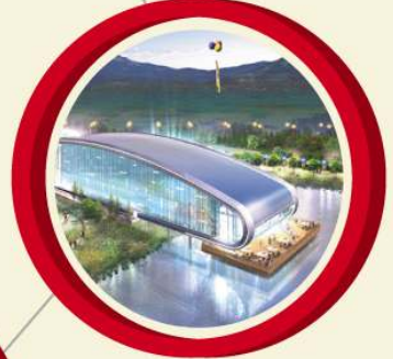
▲ 유비파크 피주시 테마공원 유비파크 외식사업단 창업 컨설팅