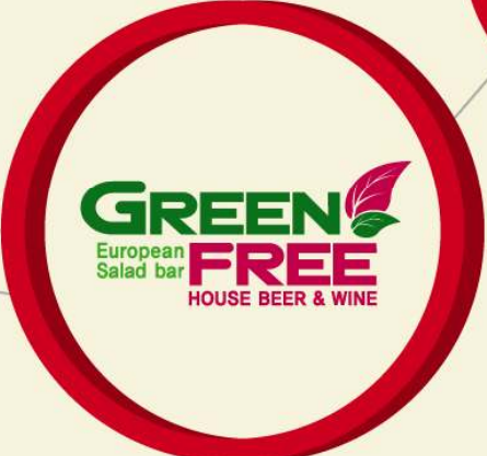
▲ 그린프리 경영관리 및 운영매뉴얼 컨설팅